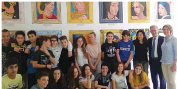
Il murales dei "volti di donna" realizzato alla scuola Gramsci

U n percorso condiviso che ha coinvolto 260 studenti delle scuole limbiatesi (dalla primaria alle superiori), tutti impegnati durante l'anno scolastico in corso con il progetto "Ready Stem Go", cofinanziato dal Comune di Limbiate e da Regione Lombardia.