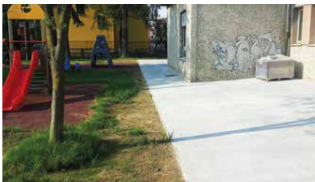
Turati materna vialetti