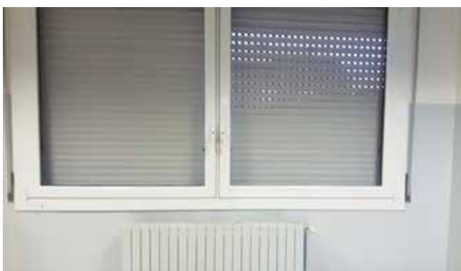
Monte Generoso infissi