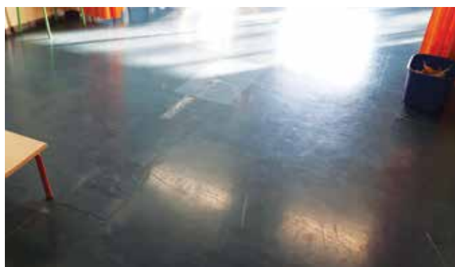
Bellaria materna pavimentazione

A partire dal corposo intervento nella scuola media di via Monte Generoso sino ad arrivare alle imbiancature di pareti e servizi igienici in altri plessi: in inverno e primavera tante sono state le opere di manutenzione attuate dall'Amministrazione comunale in 17 plessi scolastici.