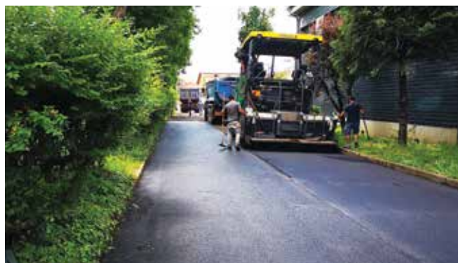
Monte Generoso vialetto