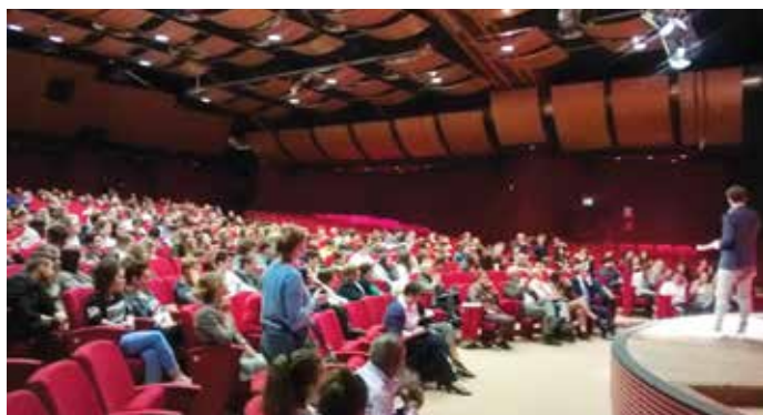
Giornata conclusiva del progetto a teatro

Successivamente è toccato ai ragazzi presentare le conclusioni dei vari laboratori attivati all'interno del progetto, che ha avuto lo scopo di contrastare gli stereotipi di genere che indicano la donna come "inadatta" e "inadeguata" in determinati campi di lavoro, di studio o di business che vengono culturalmente considerati ad appannaggio dei colleghi uomini.